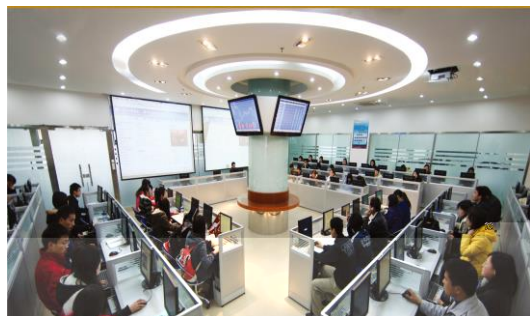
教学实验——学生在商务实验中心

学生毕业可以同时获得山东工商学院普通专科和SENECA专科文凭; 平均成绩中等以上者可豁免考试直接保研攻读SENECA本校或加拿大约克大学以及其他大学本科(专业可自选), 进行“专-本”连读以实现完美的个人学历提升。