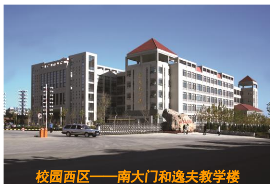
校园西区——南大门和逸夫教学楼

“儒风海运，华彩国商”，学院以“借鉴和引进国外先进的高等教育经验与资源，结合国内高等教育实际，特色办学，服务社会”为办学宗旨，以“面向世界、面向未来、分类培养、全面育人”为教育理念，以“国际化、复合化、专门化”为人才培养定位，在突出“分类培养、全面育人、国际办学”特色的基础上，创新“教学、管理和实践三育人”人才培养模式，为经济社会发展培养品学兼优的应用型国际化专门人才。