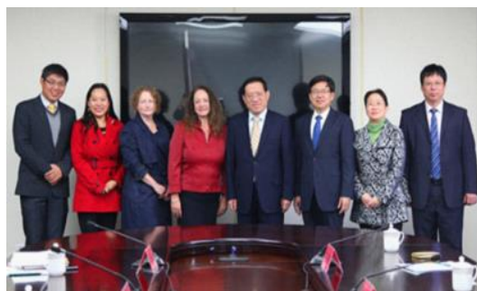
澳洲新英格兰大学代表团来访

会计专业基地班还通过与澳洲注册会计师公会(CPA Australia)合作，引入其基础课程嵌入到人才培养方案中，学生将豁免 Foundations