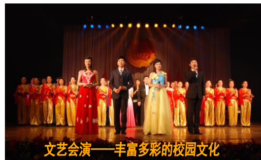
文艺会演——丰富多彩的校园文化

本专科合作办学专业采用分类培养模式, 学生可以选择有“2+2”国际化国外大学专升本人才培养模式, 即在本校完成2年英语和专业基础课学习, 然后赴国外合作院校以及加拿大温哥华岛大学、美国NYIT和澳大利亚UNE再学习2年的“专-本”连读培养模式; 学生毕业可以获得山东工商学院普通专科和国外大学本科文凭; 平均成绩中等以上者可免试保研攻读国外研究生(专业可选), 以实现完美的个人学历提升; 在国内完成学业者可获得山东工商学院专科文凭。